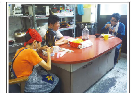
みんなで温かい給食をいただきます