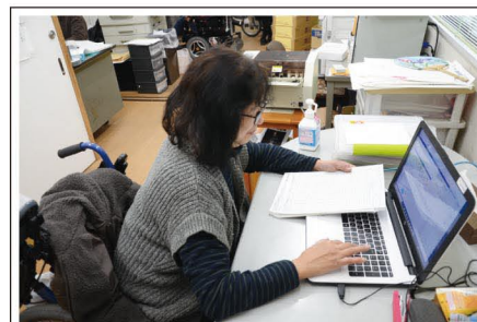
2階のパソコン使用作業