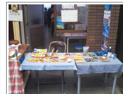
1階入口にてパンや海産物を販売しています