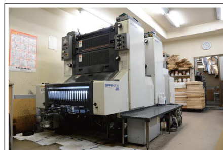
平野区の印刷工場のオフセット印刷機

ご予算に合わせて書籍の作成や、名刺の作成。介護事業所様向けの介護伝票も作成しております。印刷に関することならなんでもお気軽にご相談ください。