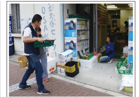
浪速区のパーティーパーティーさんにて