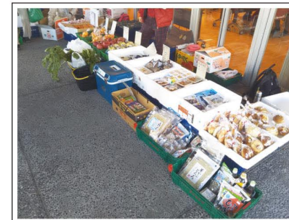
パンや野菜、海産物等販売品