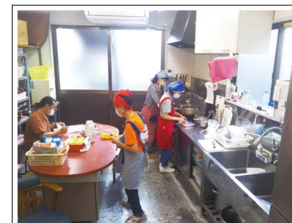
調理場の風景です

1階はカフェスペースになっており、おいしいコーヒーや紅茶、夏には冷たいソフトドリンク、冬には温かいココア等をご用意(各1杯100円)しております。このほかにも軽食も用意しております。ぜひご来店ください。