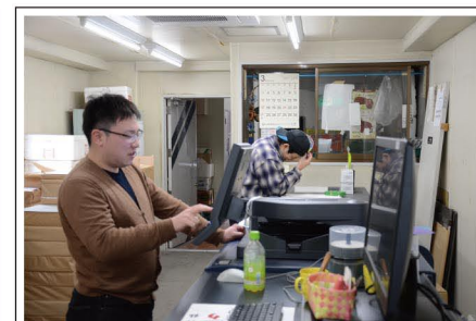
3階のオンデマンド印刷機使用作業