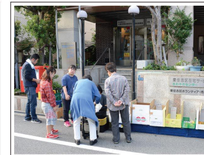
お客さんがいらしてくれました